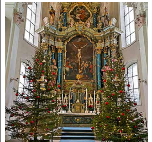
Kirche Lachen Weihnachten 2018