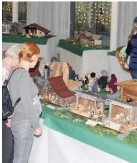
Krippenausstellung 2018

Als Aussteller der Krippen sind Einzelpersonen, Familien, Verein, Gruppen, Schulklassen und Künstler aufgerufen, ihre Werke zu präsentieren.