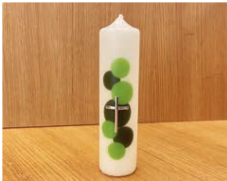
Die aktuelle Heimosterkerze.

Den sieben Haupttugenden – also der Summe aus den drei göttlichen Tugenden und den vier weltlichen Kardinaltugenden – stehen die sieben Todsünden gegenüber: