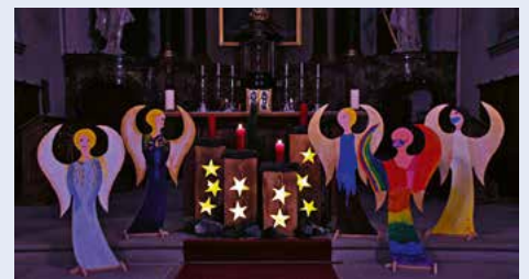
5 Engel, gestaltet von Firmandinnen, begleiten uns durch diesen Advent und die Weihnachtszeit.

Gott zu erkennen im Hin und Her unserer Zeit, im Auf und Ab unseres Lebens, seinem Licht in uns Raum zu geben, das möchten wir nicht nur, aber vor allem an Weihnachten. Dafür feiern wir auch die Gottesdienste, dieses Jahr in grösserer Zahl, aber in kleineren Gruppen und mit all den Vorsichtsmassnahmen, an die wir uns mittlerweile gewöhnt haben.