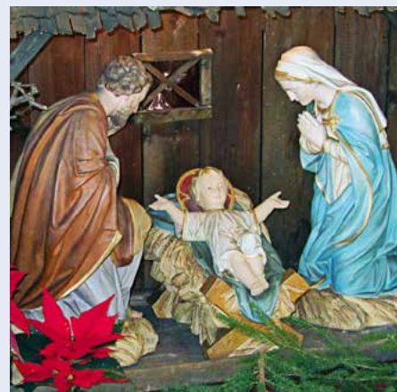
Krippe in der Kapelle im Ried.

21.00 und 22.30 Uhr Musik: Florian Harder, Harfe