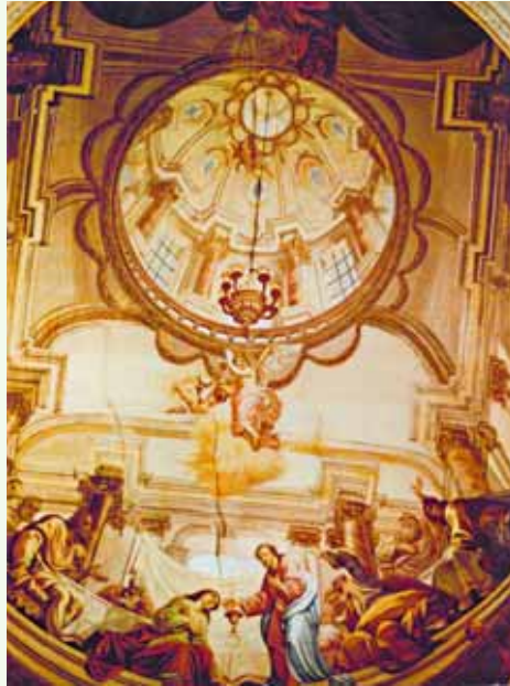
Deckengemälde mit glaubhafter Raumillusion im Kirchenschiff vor 1960.

Auch dieser zweite Kirchenbau musste weichen, um einem viel grösseren, dem dritten Gotteshaus Platz zu machen. Es war die Zeit der Gotik . Wer in die Höhe baut, ist gut sichtbar und kann Macht und Reichtum demonstrieren. Dieser in die Höhe strebende gotische Baustil mit den charakteristischen Stichbogen und den Rippengewölben erlaubte es, in ganz neuen Raumdimensionen und Raumformen zu bauen. Hohe, schlanke spitzbogenförmige Fenster durchbrechen und gliedern jetzt in regelmässigen Abständen die sonst geschlossenen Aussenwände. Der sakrale Innenraum wird heller. Platziert wurde die dritte und heutige Kirche im Osten der beiden Vorgängerkirchen. Der Turm wurde nicht abgerissen, sondern mit in die nördliche Wand der neuen Kirche integriert. Am 1. Juli 1464 (vor 555 Jahren) wurde die neue, im spätgotischen Baustil errichtete Kirche eingeweiht. Der Kirchturm, der ein Käsbissendach (Giebeldach) besass, wurde 1620 um ein zusätzliches Glockengeschoss erhöht. Nach einem Blitzschlag im Jahr 1706 entstand der heutige, weit-