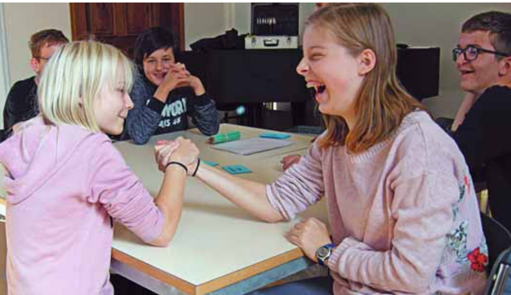
Kräftemessen anlässlich der RU-Einheit «Glück – glücklich sein» in der Kollegi-Kapelle, welche als Unterrichtsraum für die Projekteinheiten genutzt wird. In der Kapelle finden auch alle anderen Angebote sowie die Feiern und Besinnungen der Kollegi-Seelsorge statt.