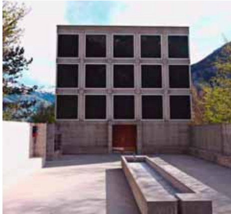
Vor der Autobahn-Kapelle im Aussenhof befindet sich der Brunnen mit fließendem Wasser.

Träger des «Ortes der Besinnung» ist eine gemeinnützige Stiftung. Sie wurde 1997 gegründet und war für den Bau zuständig. Heute sorgt sie für den Betrieb und den Unterhalt. Aktuell ist Josef Arnold aus Seedorf Präsident des Stiftungsrats. Er weiss, warum die einzige Autobahnkapelle der Schweiz im Kanton Uri ansässig wurde: