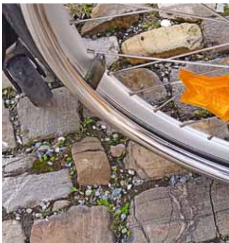
Wenn die Bsetzsteine nicht abgeschliffen sind, ist das Vorwärtskommen mit Rädern schwierig.

🌐 www.hindernisfreier-klosterplatz.ch Spendenkonto: IBAN: CH50 0077 7005 6144 8754 4 Schwyzer Kantonalbank 6431 Schwyz, zugunsten: «Stiftung für die Klöster Einsiedeln und Fahr», Zahlungszweck: Hindernisfreier Weg Klosterplatz Einsiedeln.