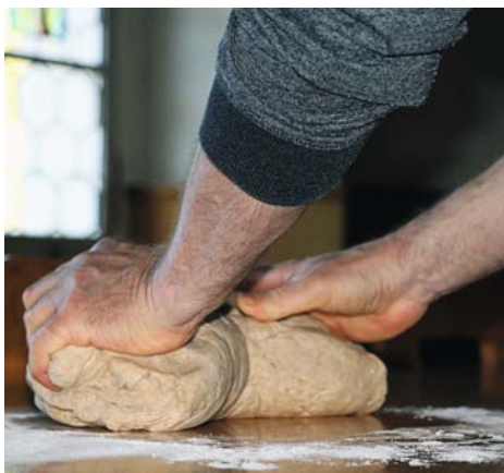
Mehl und Wasser zu einem Brotteig kneten, kann mit vielen Erfahrungen verbunden sein.

ger er knetet, desto mehr Energie fliesst in den Teig, bis er schliesslich merkt, wie er richtig Dampf ablässt. Zaghafte steigt so manch unverarbeitete Wut in ihm auf und findet den Weg in den Teig, welcher er nun heftig schlägt und traktiert. Die Luftblasen werden mehr und mehr, ganz zur Freude von Elisabeth.