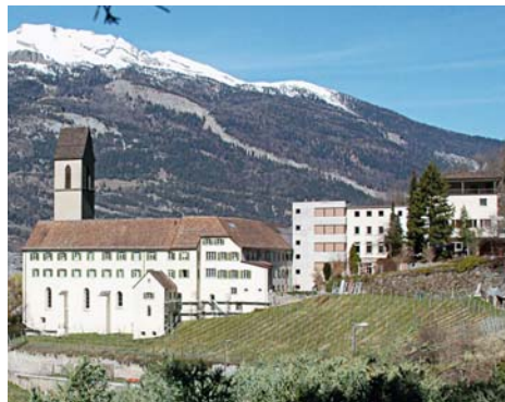
Die Gebäude des Priesterseminars (l.) sind mit der theologischen Hochschule (r.) zusammengewachsen.

Den entsprechenden gesellschaftspolitischen und kulturellen Auftrag nimmt die Hochschule unter anderem durch kantonale Kooperationen, öffentliche Veranstaltungen und mediale Präsenz wahr. Wo möglich, sucht die Hochschule dafür die ökumenische Zusammenarbeit mit der Evangelisch-reformierten Landeskirche Graubünden.