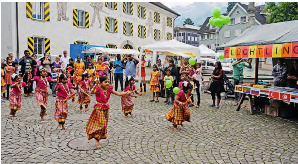
Einheimische und Zugewanderte am Urner Flüchtlingstag.

In der Arbeitshilfe «Leitsätze des kirchlichen Engagements für Flüchtlinge», im Jahr