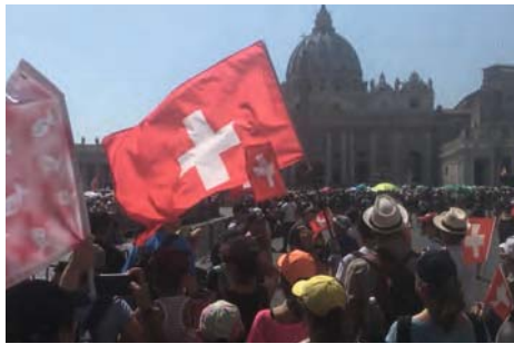
Lachner Minis besuchten Rom.

Drei Lachner Ministranten nahmen mit 300 Schweizer und insgesamt über 60'000 Minis aus der ganzen Welt an der internationalen Ministrantenwallfahrt nach Rom teil. Eine Woche lang erlebten wir die Ewi-