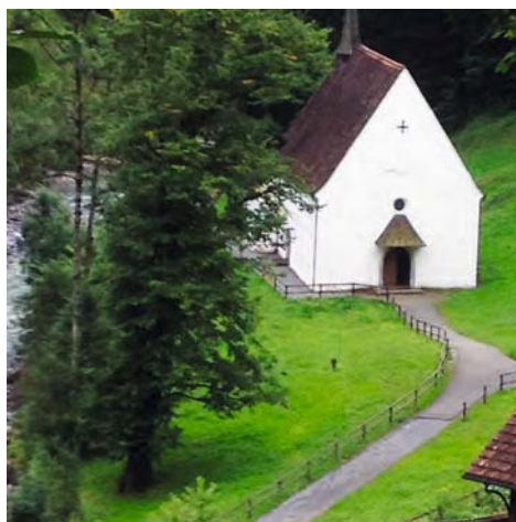
Die Wirkstätten des Landeheiligen wurden in Erinnerung gerufen.

Eines der Projekte wurde zusätzlich mit einem «Iron Communicator» für herausragende Leistungen prämiert. Welches Unternehmen diesen Zusatzpreis erhält, wird später zusammen mit der Begründung der Jury bekannt gegeben.