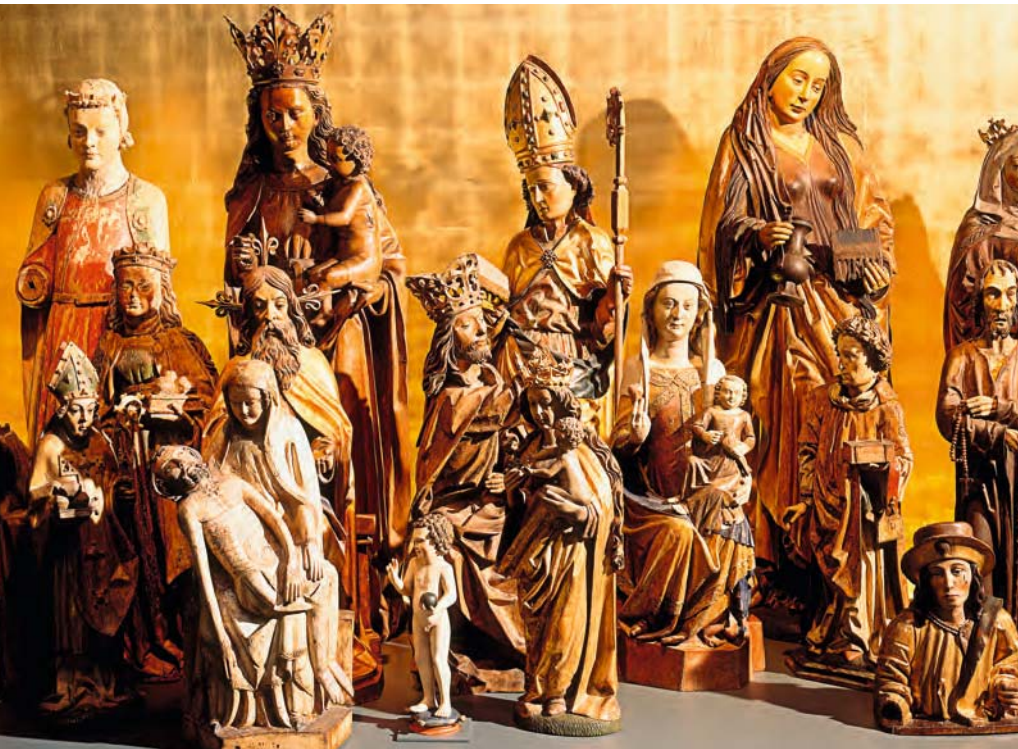
Heilige wurden im Mittelalter bei Alltagsorgen, Unwetter, Hungersnot oder Krankheiten angebetet.