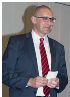
Ein Kommentar von Martin Spilker, Redaktionsleiter Katholisches Medienzentrum, Zürich

Die Kirchen erbringen bedeutende Leistungen für die Gesellschaft. Das ist wichtig zu wissen, wenn es um das Thema «Kirchensteuern» geht. Darum braucht die Kirche Öffentlichkeit.