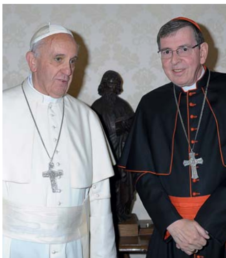
Papst Franziskus und der Schweizer Kardinal Kurt Koch, einer seiner engsten Mitarbeiter.

Vermutlich Mitte September besucht der Papst Estland, Lettland und Litauen. Dies könnte man als Zeichen verstehen, dass Franziskus auch in Europa «an die Ränder» geht. Seit Johannes Paul II. (1993) war dort kein Papst mehr zu Gast. Nicht zuletzt die geopolitische Lage dieser östlichen Nato-