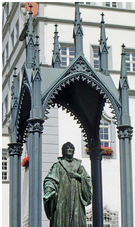
Das Lutherdenkmal in Wittenberg.