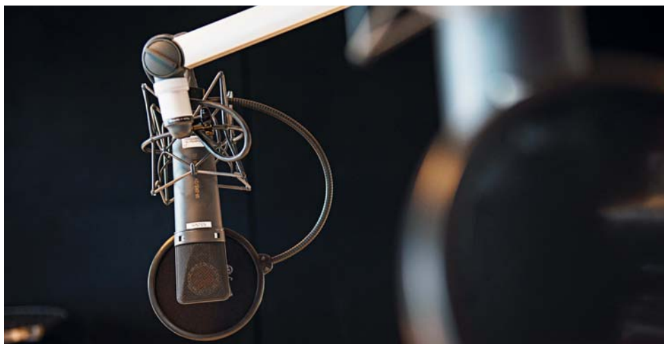
Mikrofon im Radiostudio

Die Volksinitiative «Ja zur Abschaffung der Radio- und Fernsehgebühren» will Artikel 93 der Bundesverfassung ändern: Radio- und Fernsehveranstalter, welche heute mit einer Konzession versehen sind und über Gebühren finanziert werden, sollen künftig keine Empfangsgebühren mehr erhalten. Ausserdem sollen weitere direkte Subventionszahlungen an Radio- und Fernsehveranstalter unterbleiben. (sys)