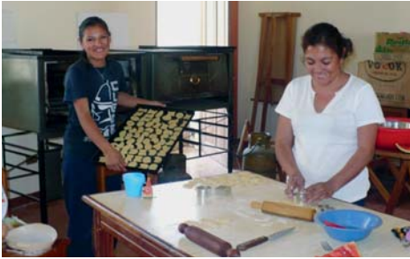
Frauen bei der Küchenarbeit im Mutter-Kind-Haus.

Gerne laden wir Sie ein zum Suppentag am Sonntag, 18. Februar 2018 , im Pfarreizentrum. In diesem Jahr unterstützen wir das Mutter-Kind-Haus des Kolpingwerks in Cochabamba, Bolivien. Das Kolpingwerk Boli-