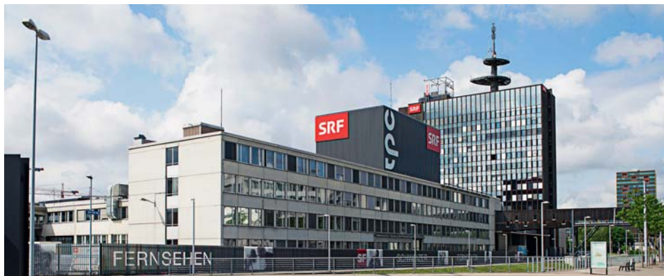
Das Fernsehstudio Zürich Leutschenbach.

Die RKZ erwähnt in ihrer Mitteilung auch den Beitrag der SRG zur Bildung, zur kulturellen Entfaltung und zur freien Meinungsäusserung. Die Kirche hat allerdings