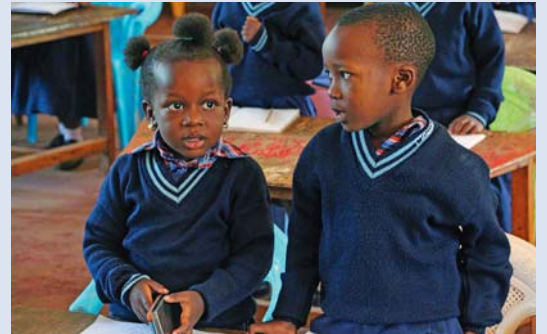
Von Salesan unterstützte Schule in Mkusa, Tansania. So herzlich diese Kindergartenkinder sind, so adrett ihre Schuluniformen, sie wachsen in einem äusserst schwierigen und unsicherem Umfeld auf.