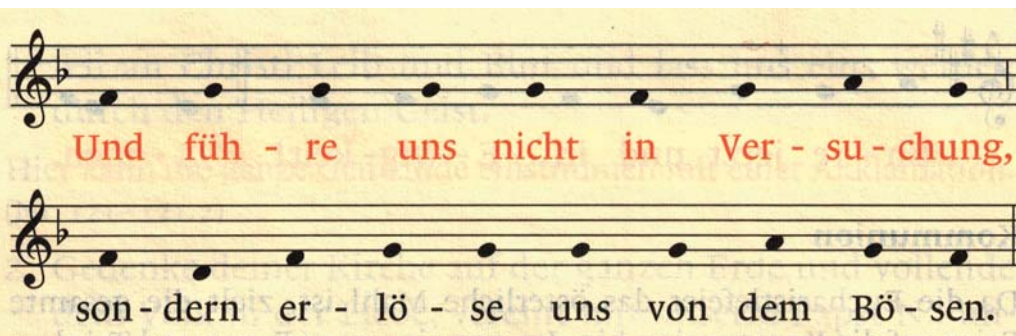
Die rot eingefärbte Bitte bietet Gesprächsstoff.