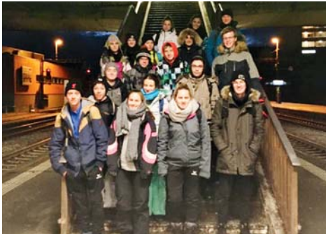
Die Firmgruppe auf dem Weg zum Ranfttreffen.

Das Ranfttreffen ist eines der grössten kirchlichen Jugendtreffen der Schweiz. In diesem Jahr konnten wir mit 17 Firmanden daran teilnehmen. Jeweils am Wochenende vor