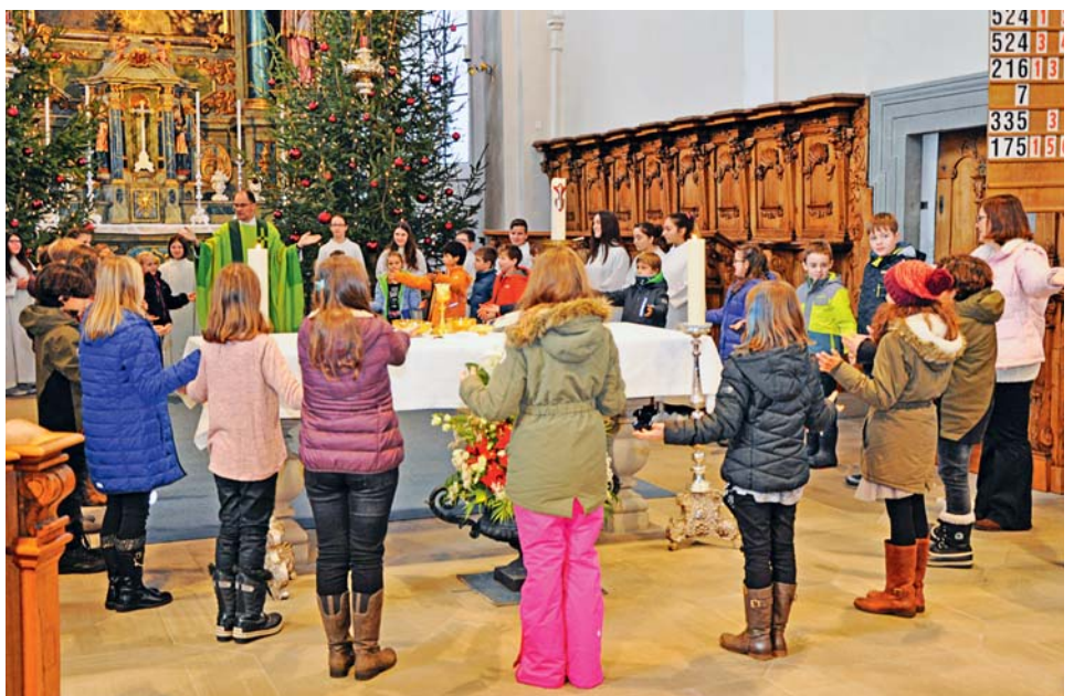
Herzliche Einladung zum Sonntagsgottesdienst am 14. Januar zusammen mit den Erstkommunionkindern.

Der heilige Mönchsvater Antonius wurde früher auf dem Land meist «Sülitoni» genannt. Die Bauern erhofften Hilfe und Schutz dank seiner Fürbitte. Zu seinem Attribut – dem Schwein – gibt es verschiedene Erklärungen. Eine besagt, dass Antonius sich ein junges Schwein hielt. Mit diesem ging er, eine kleine Glocke läutend, von Haus zu Haus und bat darum, das Schwein zu füttern. Wenn es dann genügend Fleisch angesetzt hatte, wurde es geschlachtet und das Fleisch an die Armen verteilt.