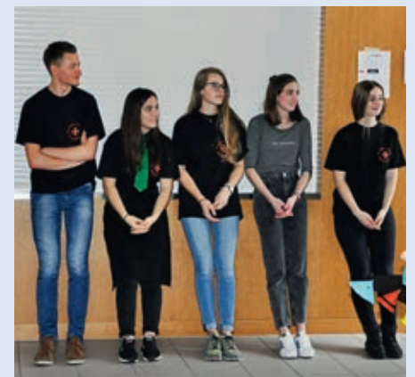
Gespanntes Warten auf die Rangverkündigung.