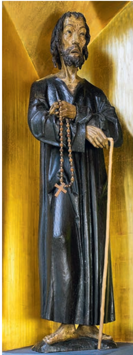
Statue von Bruder Klaus in der unteren Ranftkapelle.

geschützt werden. Auch die Obrigkeiten, die kirchliche und die staatliche, hatten ein