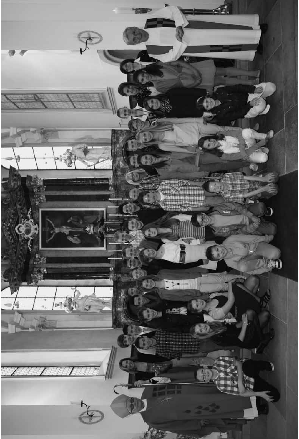
Firmung in Altendorf am 2. Juni 2013