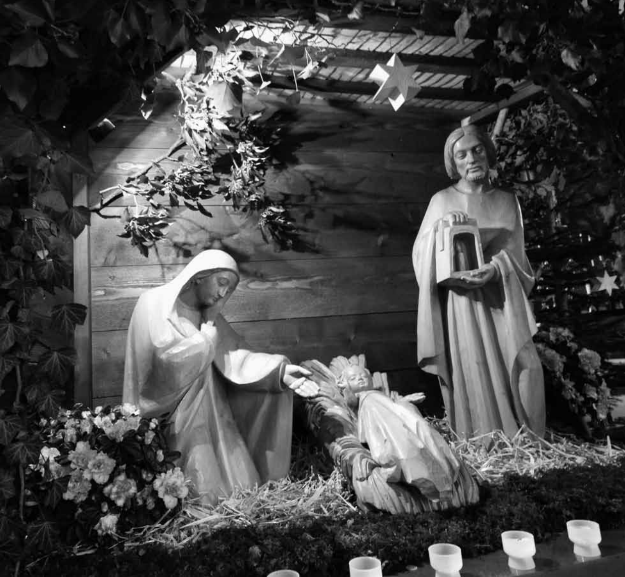
Krippe Pfarrkirche Feusisberg SZ