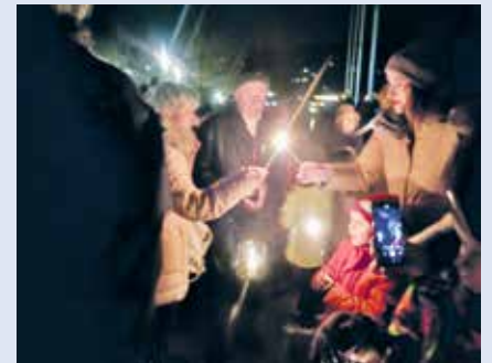
FL-Ankunft in Lachen im 2023

«Die Hoffnung ist ein Licht in der Dunkelheit.»