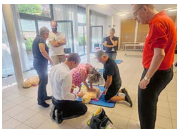
Nothelfer-Kurs Pfarrteam, 23. August