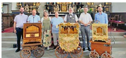
«Chilbi-Gottesdienst», 1. September