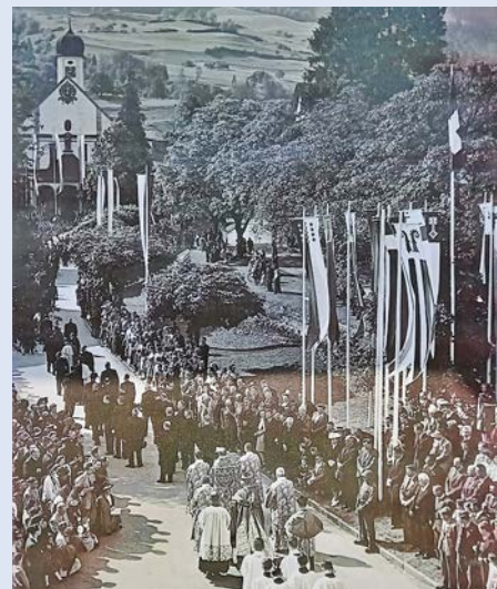
Pfingsten im Jahr 1947, tausende von Menschen feierten die Heiligsprechung von Bruder Klaus.

Jeweils um die 600 Gläubige säumen den Kirchenraum, lauschen den Worten des Festpredigers (oft ein Bischof oder ein Abt) und begeben sich innerlich auf die Spurensuche eines Friedens, der allweg in Gott zu finden ist. Wenn alle am Schluss das «Grosser Gott wir loben