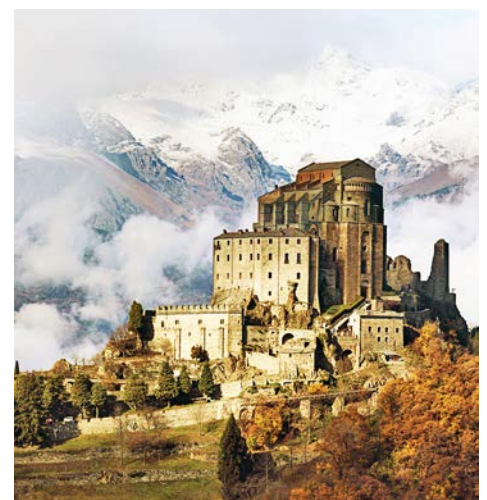
Sacra di San Michele bei Turin

Eine besonders eindrucksvolle Erscheinung ist die Sacra di San Michele im Piemont. Im 10.-13. Jh. erbaut wirkt sie wie eine Mischung aus Kloster und Burg., die auf einem 962 m hohen Berg das Susatal überragt, das seit jeher die Verbindung von