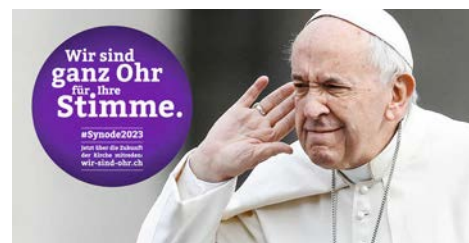
Bekanntes Bild, das in den Medien viral ging.

Die zweite geht demnächst über die Bühne – vom 2. bis 27. Oktober in Rom. Zur Vorbereitung dazu hat der Papst vor drei Jahren eine breit abgestützte Umfrage an Katholiken auf der ganzen Welt gestartet. Während dieser Zeit haben Gläubige mit ihren Bischöfen beraten, was für eine gute Zukunft der Kirche wichtig ist. Diese Vorbereitungsphase lief auch in unserem Bis-