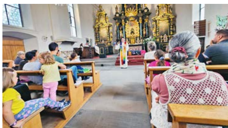
Segnung der Schul-Kinder, 25. August