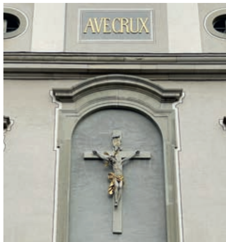
Hauptfassade der Pfarrkirche.

Schon 1456 ist eine Kapelle in Lachen erwähnt. Diese war dem Heiligen Kreuz geweiht. Sie wurde am 4. Mai 1520 von Papst Leo X. zur Pfarrkirche erhoben. Seither feiert Lachen sein Patrozinium am 14. September bzw. verlegt auf den 2. Septembersonntag. Und dies normalerweise mit grossem Getöse, nämlich der Chilbi, die dann allerdings 1943 eine Woche vorverschoben wurde, weil das Zürcher Knabenschiessen