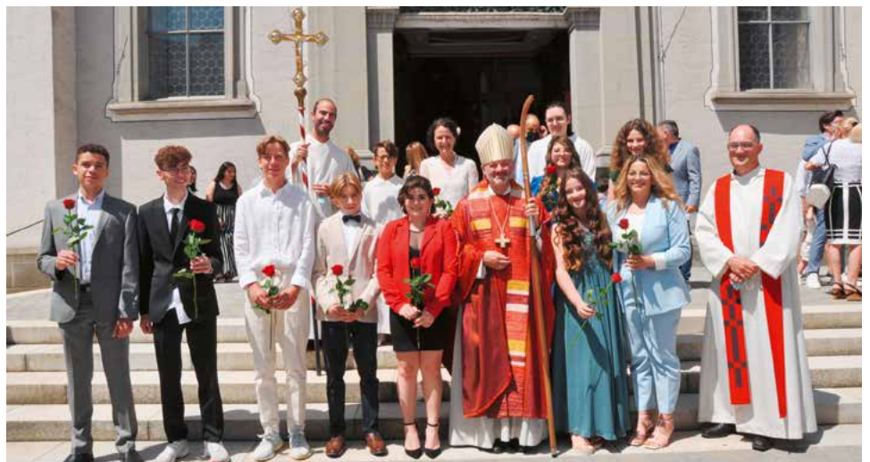
Die Firmantinnen und Firmanden mit ihrem Firmspender und den Firmbegleitern.