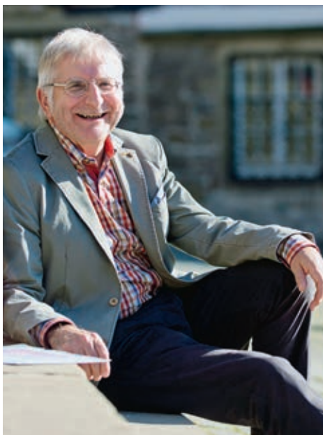
Erfolgsautor Pierre Stutz.

le darf man nicht haben, das habe ich in meiner Kindheit gelernt. Heute kann ich damit anders umgehen. Diese Gefühle sind einfach da. Ihnen auf den Grund zu gehen heisst: Ich nehme sie ernst. Sprachlich kann ich heute relativ einfach sagen: Ich fühle einen heiligen Zorn. Lange hatte ich keine Sprache dafür.