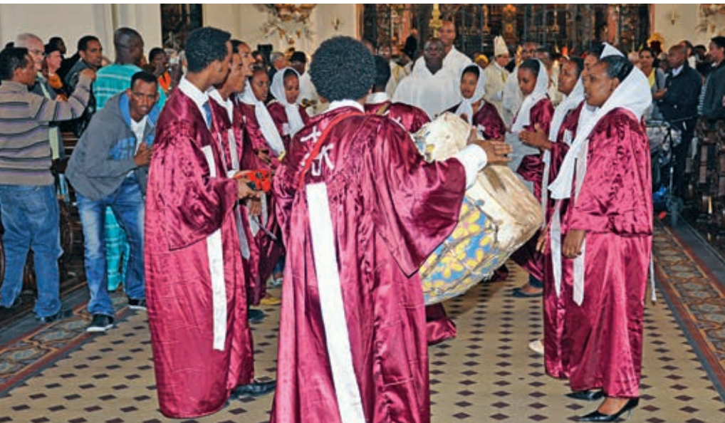
Neben Deutsch, Französisch, Italienisch und Englisch werden an der afrikanischen Wallfahrt auch Lingala, Igbo, Tygrinna und andere afrikanische Sprachen zu hören sein.