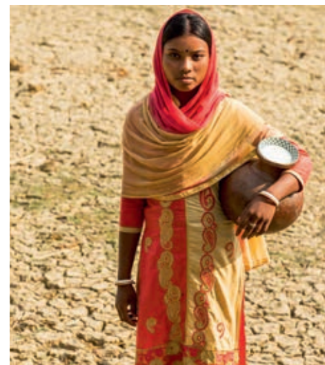
Die Wasserknappheit macht zu schaffen.

einen tiefen Brunnen mit Tauchpumpe gebaut. Eine Solarpumpe sorgt dafür, dass die Bauern Wasser aus dem Teich pumpen können, ohne dass sie auf die teuren Dieselpumpen angewiesen sind.