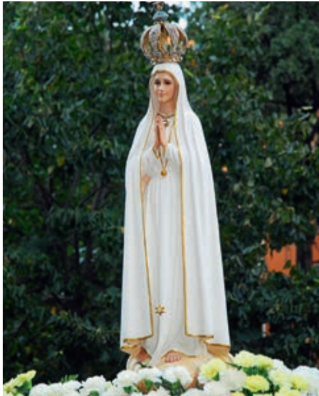
Muttergottes von Fatima.

Am 13. Mai 2017 begehen wir den 100. Jahrestag der Erscheinungen von Fatima. Auch der diesjährige Fastenhirtenbrief ist auf dieses Jubiläum eingegangen. Die Gottesmutter offenbart sich am 13. Mai 1917 drei Hirten-