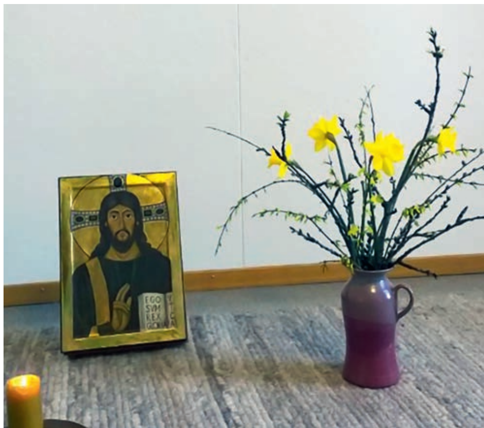
Der Gebetsraum lädt zur Stille ein und zum Blick in sich hinein, um sich seines göttlichen Kerns bewusst zu werden.

Sr. Jacqueline Clara Bühler Kloster Ingenbohl, 6440 Brunnen Telefon: +41 (0)41 825 24 80 weggemeinschaft@kloster-ingenbohl.ch Kosten Pension: CHF 40.– pro Tag bei 3,5 Std. Mitarbeit CHF 65.– pro Tag ohne Mitarbeit Weitere Informationen: www.kloster-ingenbohl.ch/aktuell/klosteraufenthalt/ Link zum Flyer: www.kloster-ingenbohl.ch/wp-content/uploads/2014/09/Angebote-Weggemeinschaft.pdf www.sakrallandschaft-innerschweiz.ch