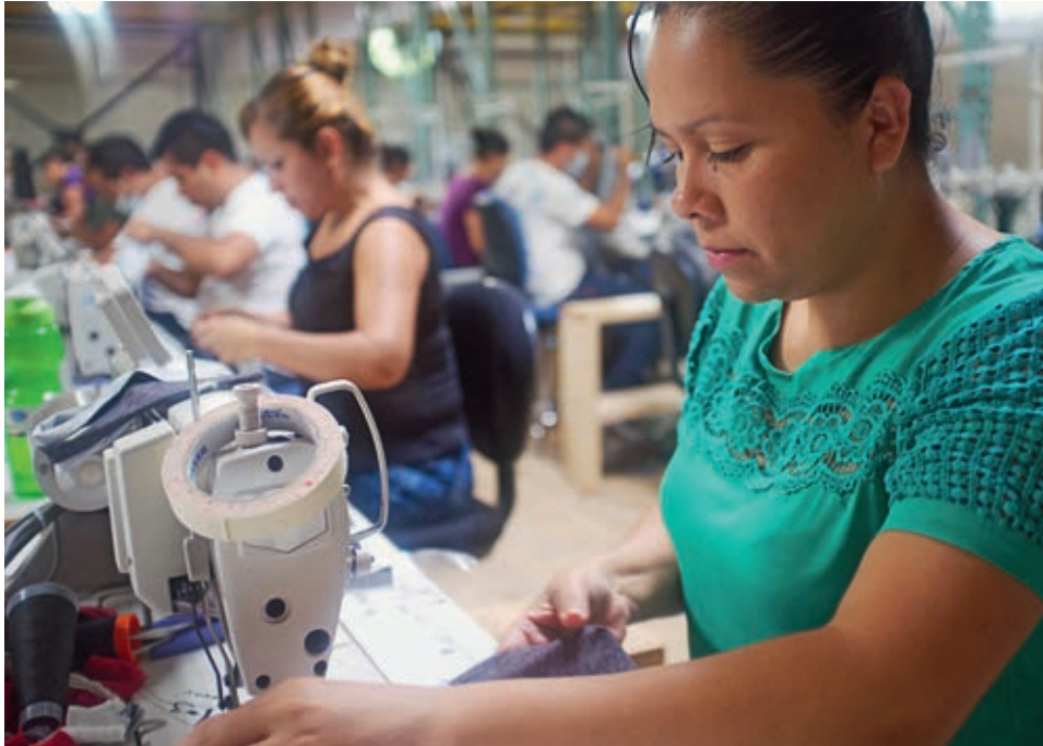
Die Arbeitsbedingungen von Fabrikarbeiterinnen in Zentralamerika sind oft miserabel.

Was bedeutet Gerechtigkeit? Wann ist etwas ungerecht? Habe ich den Mut, für die Rechte anderer mit Wort und Tat einzustehen? Diesem komplexen aber sehr grundsätzlichen Thema widmet sich die diesjährige Mai-Aktion von Brücke · Le pont.