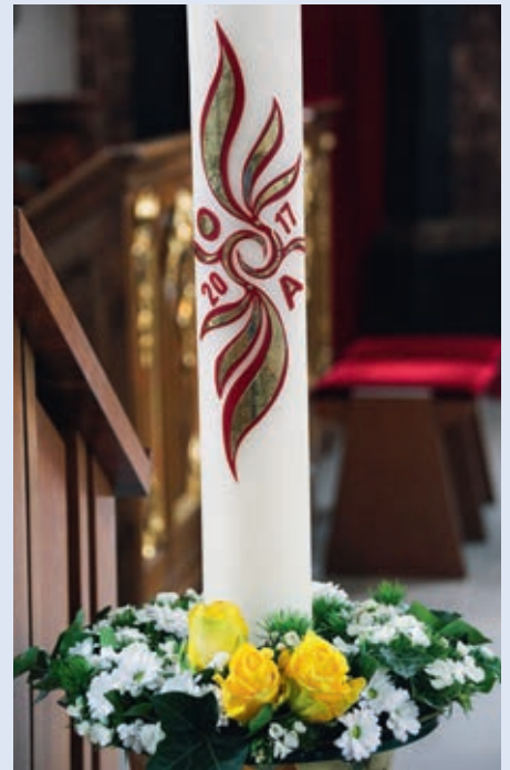
unsere Osterkerze 2017

Wenn die Nacht in unserer Welt noch herrscht, liegt das Problem nicht bei Gott. Jesus sagte: «Ich bin gekommen, um Feuer auf die Erde zu werfen. Wie froh wäre ich, es würde schon brennen!» (Lk 12,49). Dieses Feuer haben wir in unserer Taufe empfangen. Um zu wachsen und sich zu verbreiten, um die Nacht zu vertreiben, braucht dieses Feuer Nahrung. Diese bekommt es durch Gebet, geistliche Lesung und geistliche Gespräche, durch den Empfang der Sakramente und das Üben der Werke der Barmherzigkeit. Wenn wir aus der Begegnung mit Christus Kraft schöpfen und ihm als unserem Vorbild folgen, wird sich die Verheissung der Offenbarung erfüllen: «Es wird keine Nacht mehr geben und sie brauchen weder das Licht einer Lampe noch das Licht der Sonne. Denn der Herr, ihr Gott, wird über ihnen leuchten und sie werden herrschen in alle Ewigkeit» (Offb 2,5).»