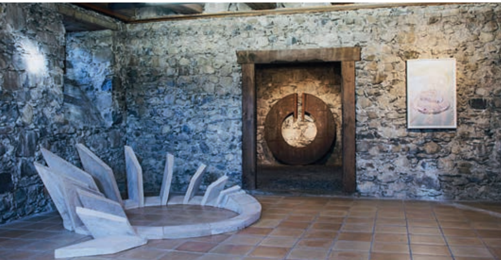
Werke von Sandra Ulloni, Gillian White und Vincenzo Baviera in der Sonderausstellung «Ins Zentrum» im Museum Bruder Klaus Sachseln.