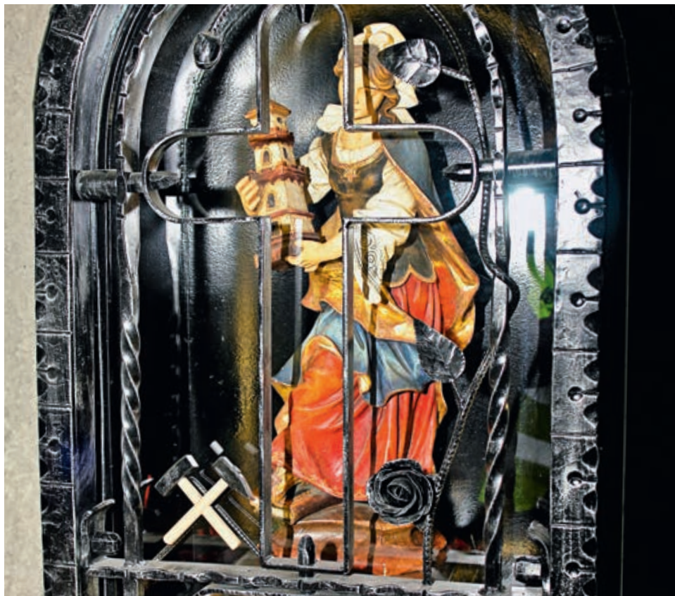
Die heilige Barbara im Gotthard-Basistunnel.

Die Faszination der heiligen Barbara auf die Bergleute beruht auf Sympathie, heisst es. Sie können mitempfunden und fühlen sich in extremer Situation verstanden. Die Symbolik des Tunnels wirkt sich im Alltag unter Tag besonders aus: Die Welt ist ein Durchgang.