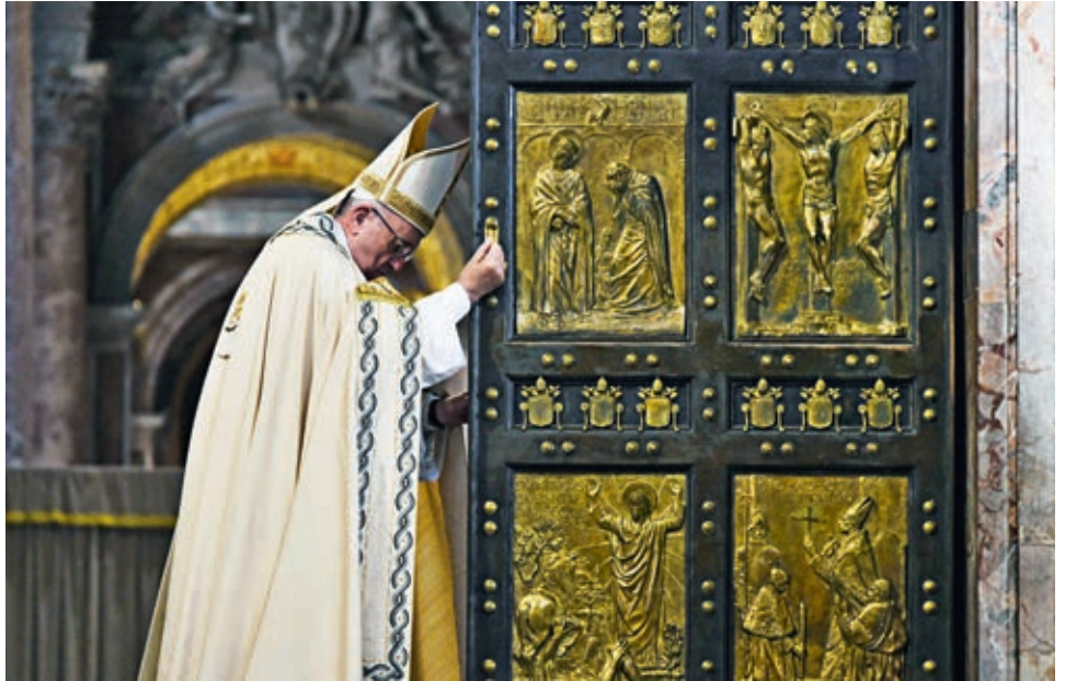
Franziskus schliesst die Heilige Pforte am Petersdom.

Das ist nachvollziehbar. In unruhigen Zeiten sind Orientierungshilfen gefragt: Anlaufstellen, Zeichen, Symbole, Handlungen. Hier kann, will und soll sich die Kirche