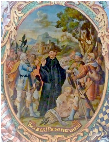
Gründung des Grauen Bundes. Gemälde im Hof Trun

Am Samstag, 11. Juni 2016, laden wir zu einer Pfarreiwallfahrt in die Surselva ein. Abfahrt ist um 07.30 Uhr beim Carparkplatz am See (beim «Steiner»). Wir feiern die hl. Messe in der Wallfahrtskirche Maria Licht etwas oberhalb von Trun (Fussmarsch!).